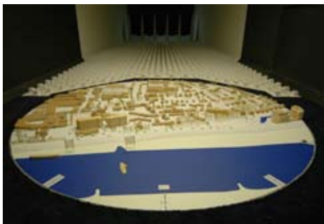
De maquette van de Cuijkse Cantheelen in de windtunnel.

Wind is van invloed op een open ligging. De ligging aan de Maas is dus een factor om rekening mee te houden. Maar ook de hogere gebouwen, die onderdeel zijn van het plan, beïnvloeden de wind. Via een windonderzoek is vooraf prima te onderzoeken op welke plekken het bijvoorbeeld regelmatig waait. De architect neemt deze gegevens mee in zijn ontwerp. Daarnaast kan hij op basis van de resultaten van het windonderzoek bepalen wat bijvoorbeeld de beste plek is voor een dakterras.