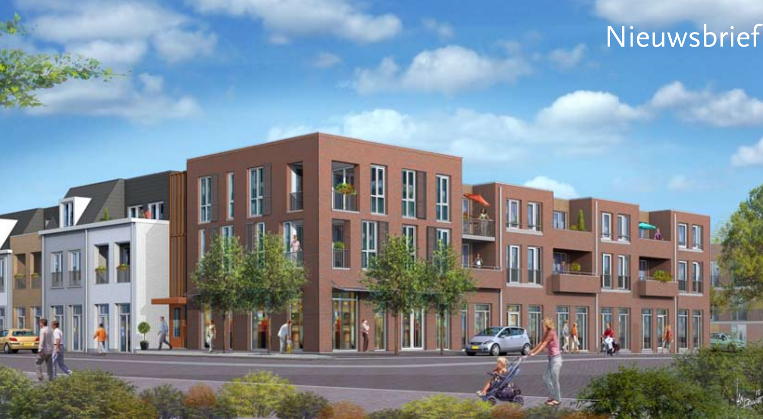
Foto artist impression 13 huurappartementen en commerciële ruimten (Hof 5) Het ontwerp is van 'Architecten aan de Maas' uit Maastricht. Kijk voor een filmpje op onze website: www.cuijksecantheelen.nl

CUIJKSE CANTHEELEN A decorative graphic consisting of several 3D rectangular blocks of various colors (orange, red, green, blue, purple) arranged in a line, partially overlapping the text below.